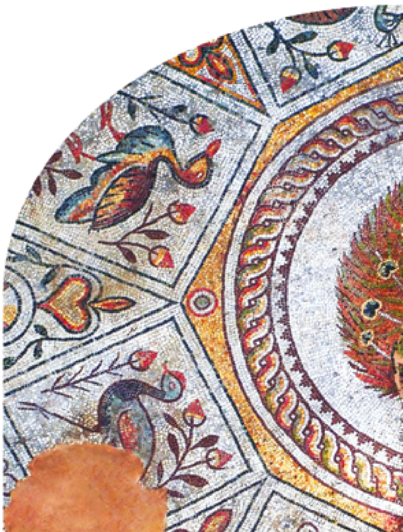
La Basílica Episcopal De Filipópolis (siglos IV - VI)