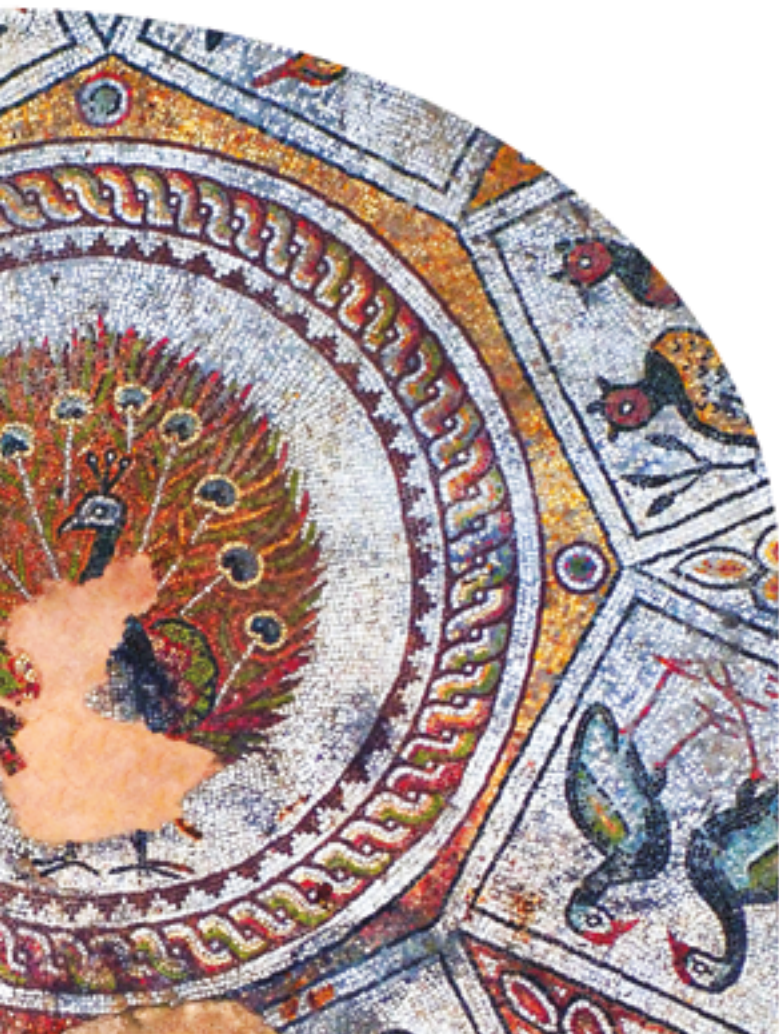
La Basílica Episcopal De Filipópolis (siglos IV - VI)