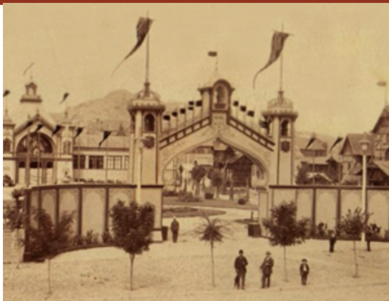
La première exposition bulgare a duré 75 jours et a été visitée par près de 168 000 personnes.

L a suite de l'Exposition de 1892, la Première Foire Internationale de Marchandises (1937) a été ouverte à Plovdiv avec la participation de 1070 exposants bulgares et de 385 sociétés de 8 pays d'Europe occidentale et des États-Unis.