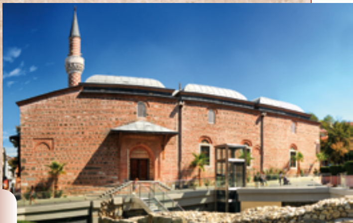
La Mosquée Dzumaya

Le bon plan d'urbanisme, le mode de construction et l'aspect général de la ville permettent de la considérer comme l'une des plus belles villes de Bulgarie. C'est ici que commence à se sentir l'ambiance bulgare. Ses habitants sont réputés pour être très travailleurs, hospitaliers et sincères.