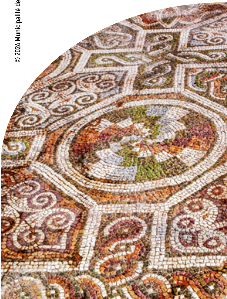
La basilique épiscopale de Philippopolis (4e - 6e siècle)

© 2024 Municipalité de Plovdiv/ Édition 4