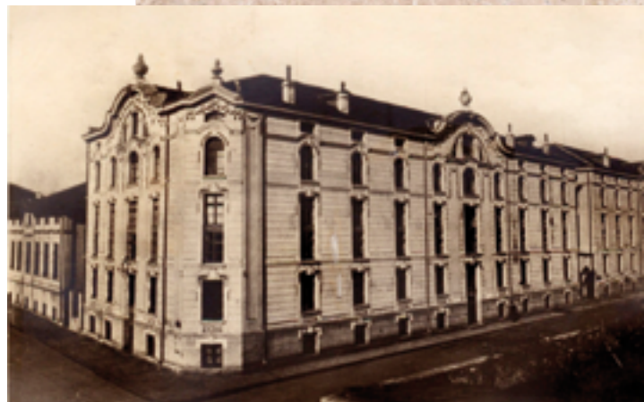
Les Entrepôts de Kudoglu, Plovdiv, la Ville du tabac, 1927

Dans les années 1930, le maire Bozhidar Zdravkov a beaucoup contribué à l'aménagement de Plovdiv. Il a réussi à mettre en œuvre un vaste programme de travaux publics qui a donné un nouveau visage à Plovdiv.