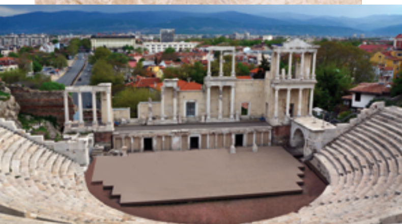
Théâtre antique, 1er siècle

F ort grande, ma foi, et fort belle, ami Hercule ! Sa beauté resplendit au loin. Un fleuve d'une vaste étendue glisse auprès d'elle et semble la caresser.