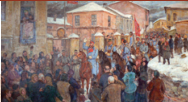
Accueil du général Gurko à Plovdiv, peintre Nyagul Stanchev

La guerre de libération russo-turque de 1877-1878 commence. Dans la nuit du 3 janvier, les unités russes avancées ont franchi les eaux glacées du fleuve Maritsa et sont entrées en bataille. Le 4 janvier, les troupes russes sous le commandement du général Gurko ont poursuivi l'offensive et ont libéré Plovdiv. Les jours suivants, les troupes de Suleiman Pacha ont été définitivement vaincues et ont cessé d'exister en tant qu'unité de combat sérieuse.