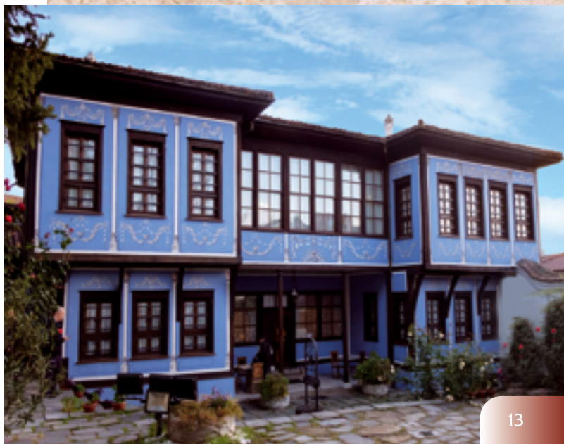
La maison Hindlian, un représentant typique de la maison symétrique de Plovdiv

Parmi les bâtiments les plus remarquables de ce type figurent les maisons de Kuyumdzhioglu, Georgiadi, Hindlian, Nedkovic, Balabanov, etc.