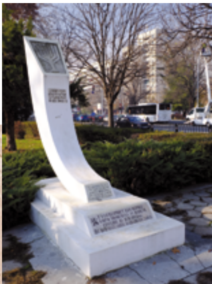
Le monument dédié à la délivrance des Juifs de Plovdiv dans le Jardin Dondukov, Plovdiv.

Plovdiv est connue comme ville de la tolérance. De différentes communautés religieuses y coexistent depuis des siècles. Outre les Bulgares, dans la ville habitent des Arméniens, des Juifs, des Turcs, des Roms, pas beaucoup de Tchèques, Russes, Italiens, Grecs et autres.